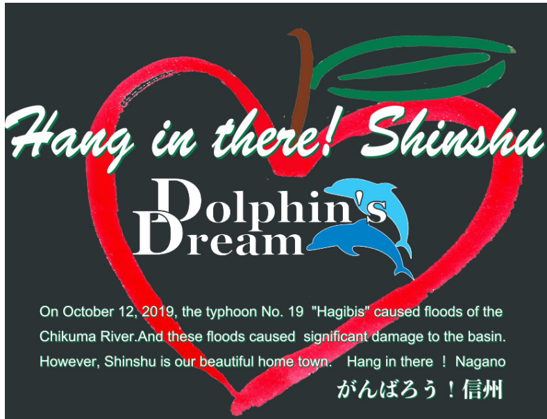
《バックプリントデザイン》

毎年ご好評を頂いております裏起毛のドルフィンズドリームパーカーの販売を、今年も企画しておりましたが、先日の台風19号による被災地を支援する為、今年は急遽デザインを“がんばろう！信州”バージョンに変更し、売り上げの一部を、被災地義援金として、長野県に寄付する事となりました。皆様ぜひご協力をお願い致します！尚、受注分のみ販売となります。裏面をご確認頂き、タイプ/カラー/サイズをご指定の上ご注文ください。